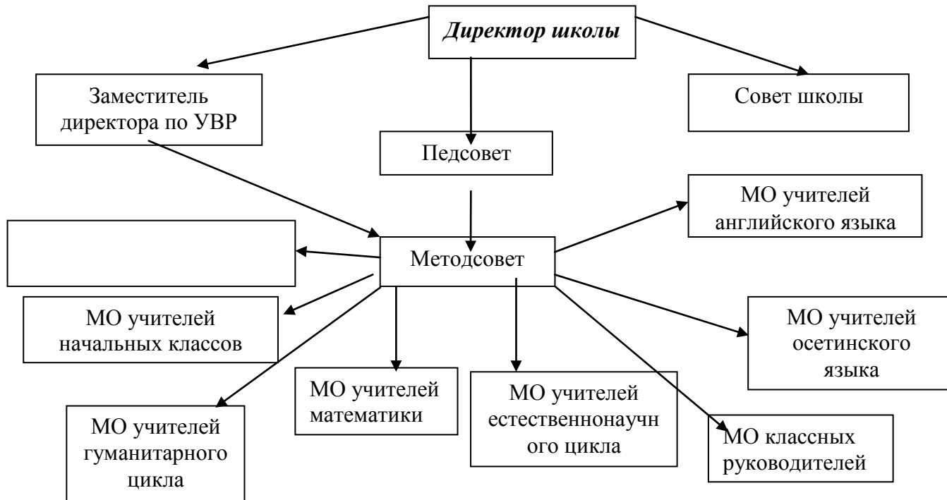
Схема методической работы в школе